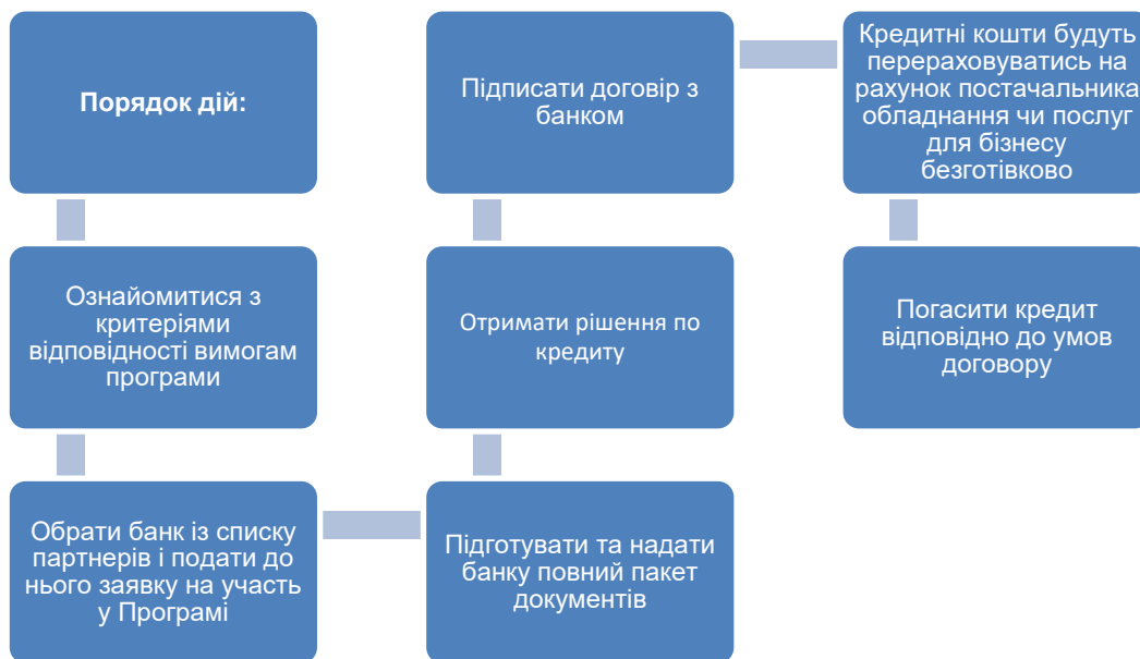
Рис.1. Алгоритм надання фінансової державної підтримки суб'єктам підприємництва за укладанням кредитного договору