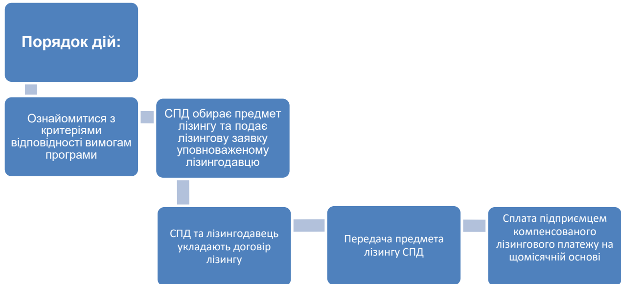
Рис.3. Алгоритм надання фінансової державної підтримки суб'єктам підприємництва за договорами фінансового лізингу

Таким чином, розширено можливості фінансової державної підтримки суб'єктам господарювання, а саме: